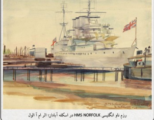
رزم ناو انگلیس HMS NORFOLK در اسکله آبادان، ابرام اول