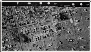
نمای پروزی از بخشی از پالایشگاه آبادان ۱۳۲۷ م